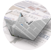
Leído en redes