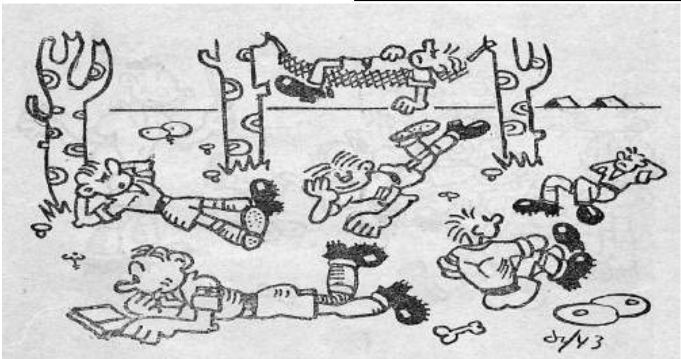
La hora de la siesta en un campamento

(De VÍNCULOS. Boletín de Acción Cultural Miguel de Cervantes. Nº 253. Mayo 2024)