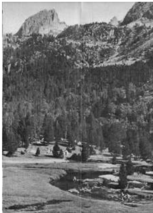
Campamento del Frente de Juventudes en San Mauricio, 1942.-Observar las tiendas en el valle.