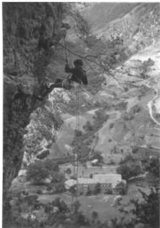
Gresolet, al pie del Pedraforca, 1941. Descenso en rápel y el santuario al fondo.