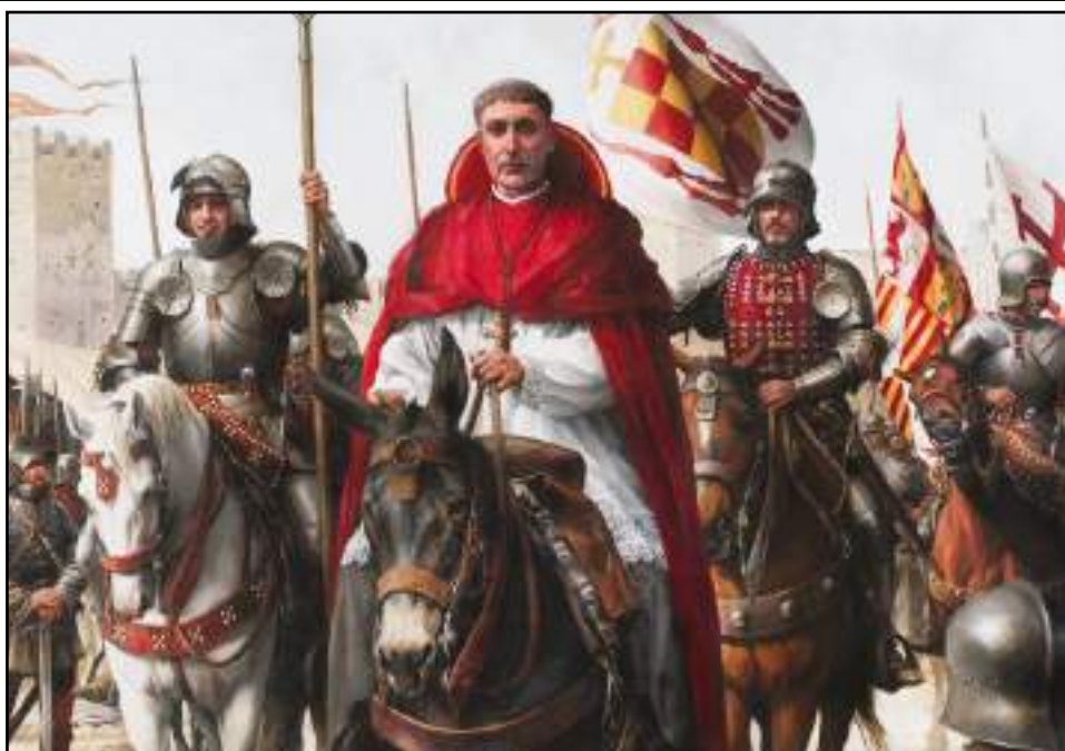
Cuadro del Cardenal Cisneros. Ferrer Dalmau