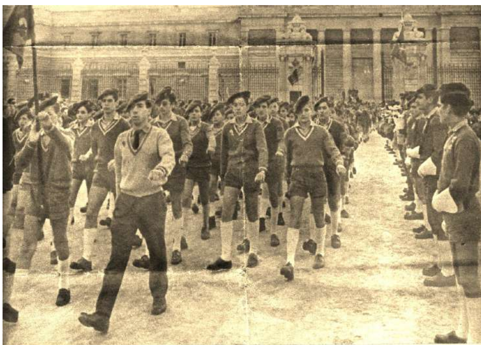
Saliendo de la Almudena