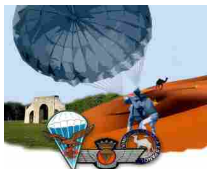
La última colonia. Paracaidistas en el Sahara, 50 años después