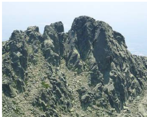
PICO DEL FRANCÉS

Laguna Grande, donde le practicaron una cura de urgencia y, posteriormente, al Club Alpino, para, más tarde, ser conducido en un automóvil a una clínica de Ávila, donde le apreciaron fracturas del cráneo, rotura del fémur y erosiones. — Cifra.