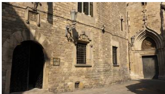
Imagen del Barrio Gótico de Barcelona