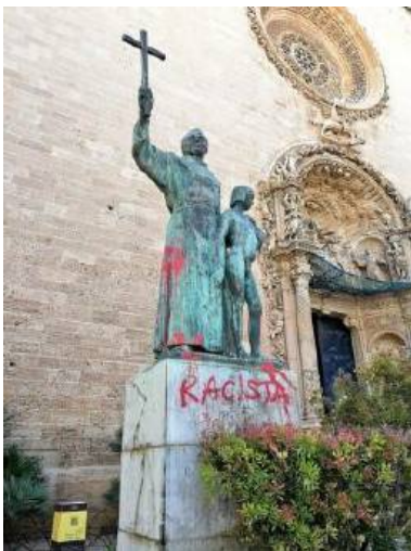
Fra. Junípero en Palma

cias a los cuales existió un Nuevo Mundo; la efigie de Cervantes es acusada de fascista ... ¿Para qué seguir?