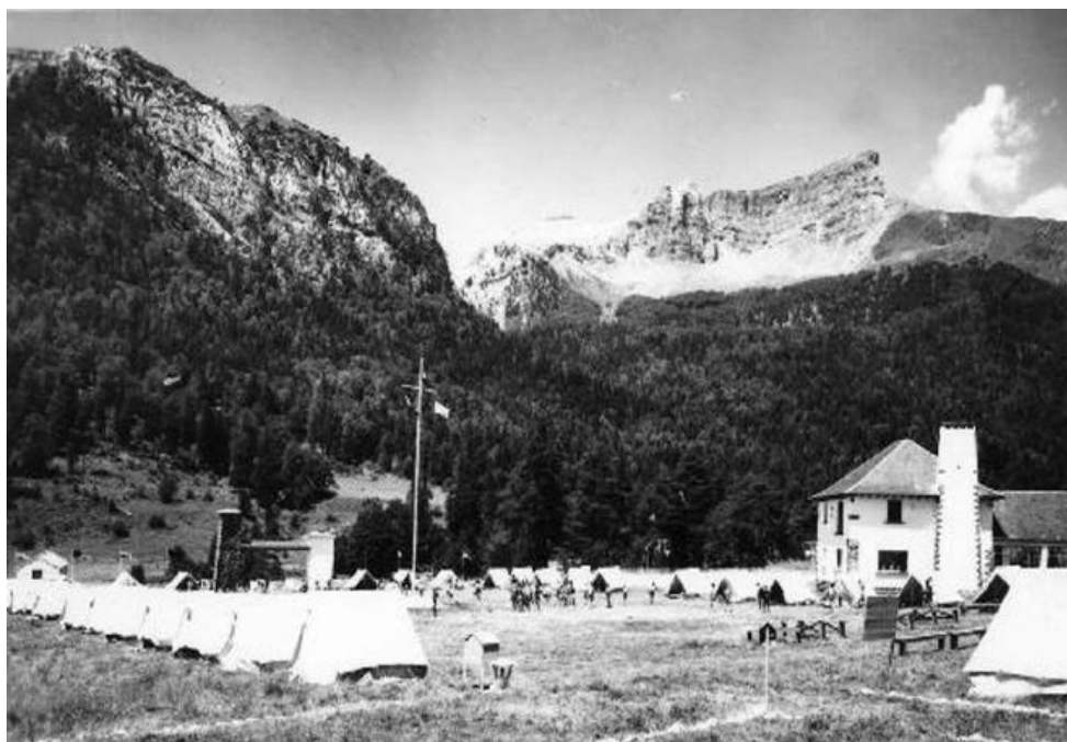
Selva de Oza Campamento Ramiro el Monje

No pudimos evitar quedarnos algo pensativos ante la valla que nos impedía el paso; un zurriagazo de nostalgia nos invadió breves instantes; pero elevamos la vista a las montañas que lo circundan y