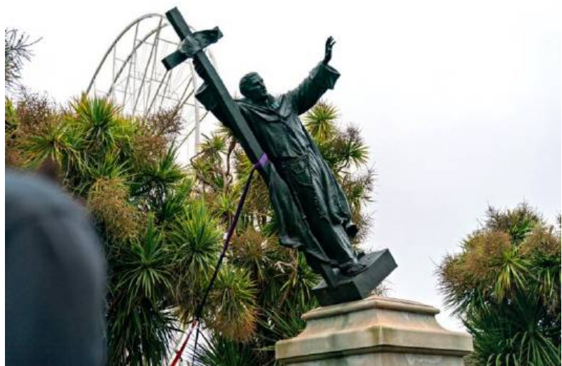
Fra. Junípero Serra - California

Una ola de vandalismo iconoclasta se extiende por el mundo occidental. Como otra epidemia, el odio sobrepasa los límites del presente y se extiende hacia la historia. Se derriban o emborronan estatuas, se quiere hacer tábula rasa de todo un pasado del hombre, que, como todo lo humano, tiene sus luces y sus sombras. Cae, por ejemplo, la figura de Baden Powell, fundador del escultismo y guía de todos los movimientos juveniles en Gran Bretaña; se abate la imagen de Fray Junípero Serra, protector de los indios, en los Estados Unidos; se abomina de Cristóbal Colón y de la Reina Isabel, gra-