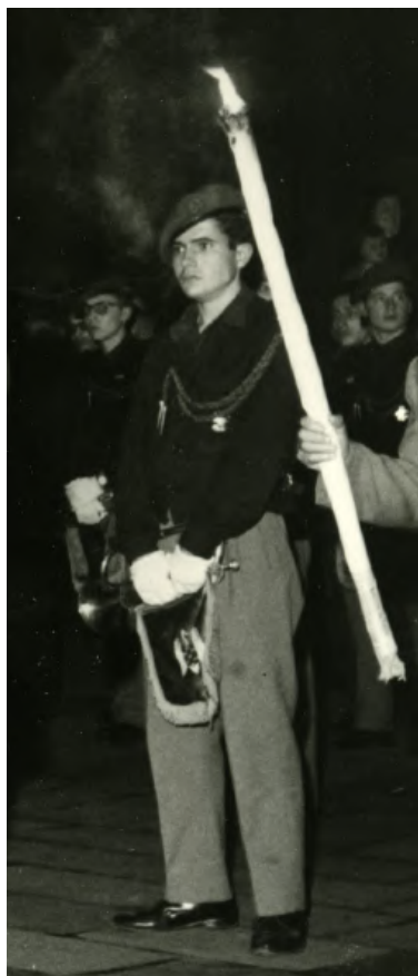
Uniforme de Banda