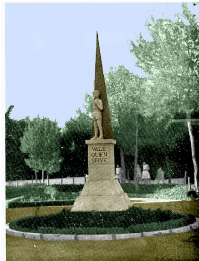
Monumento al Flecha

Como quiera que estamos acostumbrados a ver estatuas y monumentos dedicados, generalmente, a personajes ilustres, famosos y relevantes que han pasado a la Historia, no deja de sorprender que un humilde “Flecha” de la OJE pudiera ser motivo para la erección de un monumento, con su estatua y todo, en la importante ciudad cordobesa de Puente Genil.