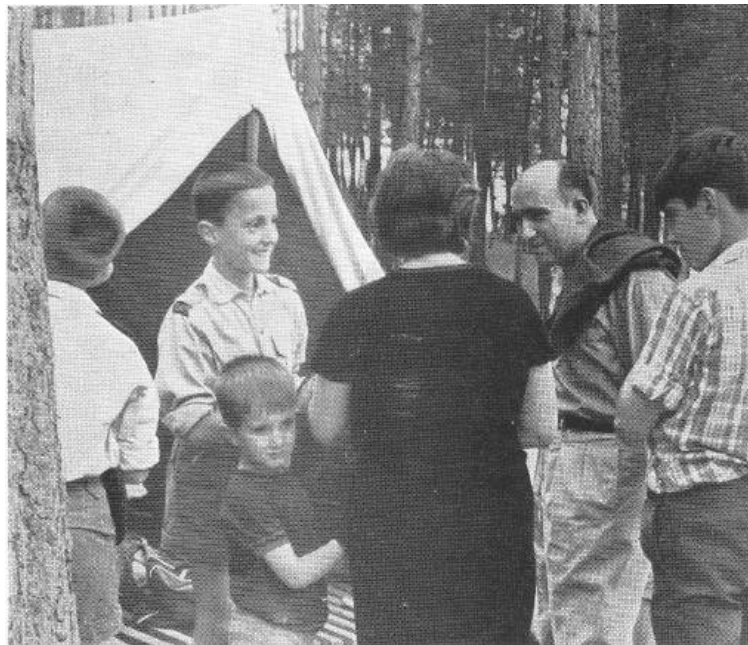
Padres de acampados visitan el campamento de Marlés. 1966

Quizás llegará un día en que se dé cristiana sepultura al último de nosotros echando la llave en el ataúd y se cierre así un glorioso episodio de la historia de nuestra España. O quizás se quede alguien la llave para un futuro. Pero hay que recordar la historia para programar el futuro.