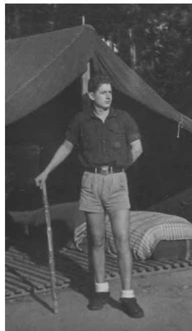
El autor en el Cpto. de Sta. María de Marlés 1960