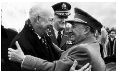
Franco - Eisenhower 1959

y, en consecuencia, se procuró atender, prioritariamente, a los campamentos, deportes, actividades lúdicas, cultura y arte.